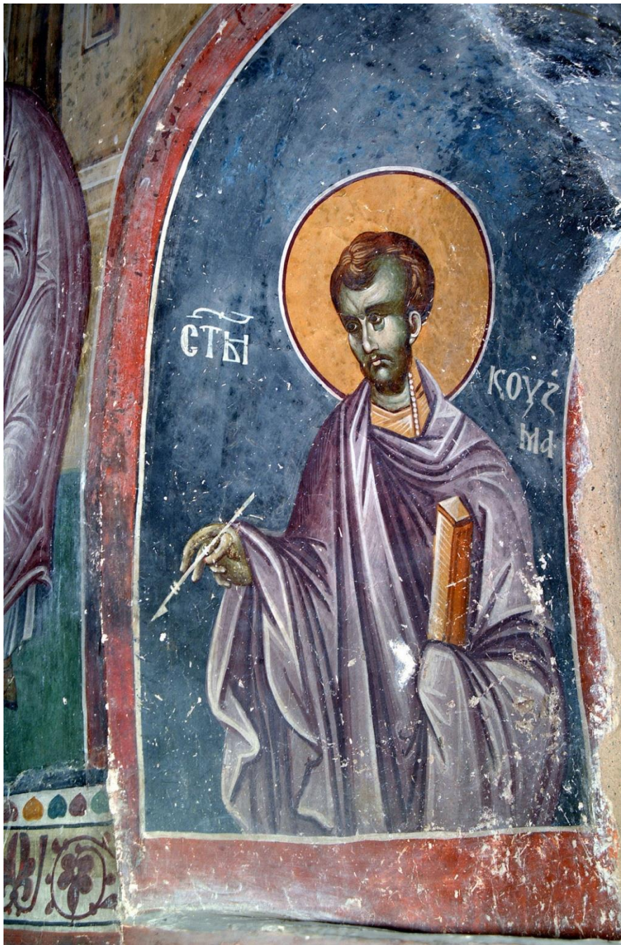
Fig. 7. Sts. Cosmas and Damian, interior side of the window above ktetorial composition, St. Joachim and Anne church, Studenica Monastery