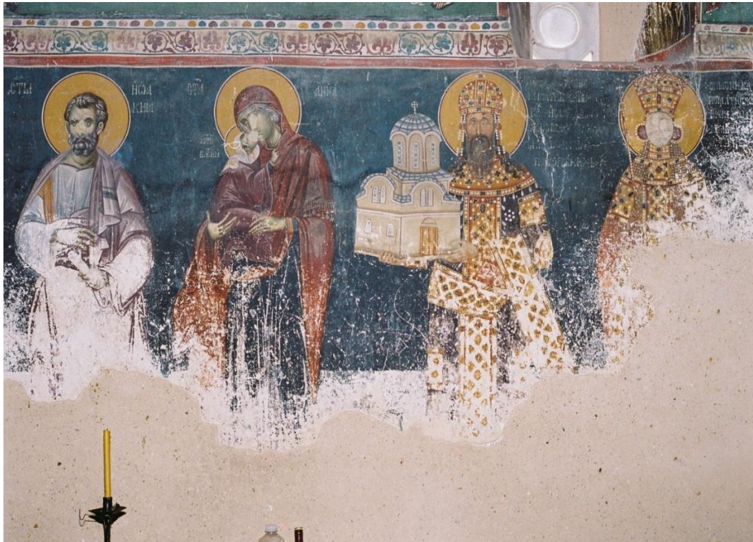
Fig.3. Ktetorial composition, St. Joachim and Anne church, Studenica Monastery