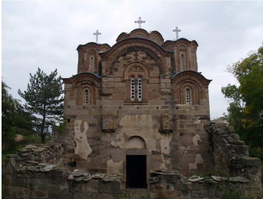
Figs. 8, 9. St. George Church / Bifora at the west façade, Staro Nagoričino/ Skopska Crna Gora (North Macedonia), photo: Jasmina S. Ćirić