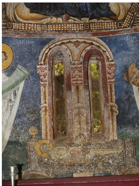
Fig.2. Knotted column painted inside of the apse of the St. George church, Kurbinovo, North Macedonia