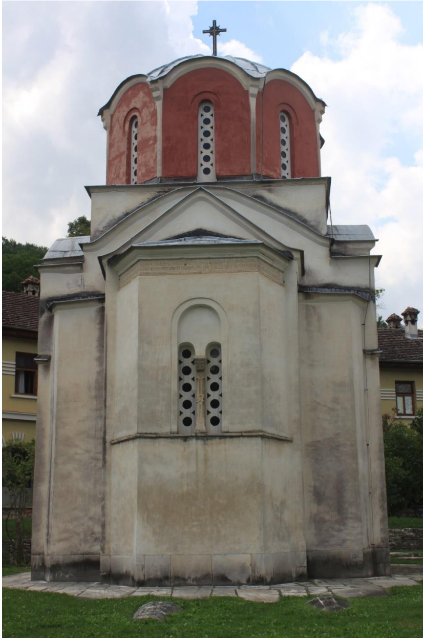
Fig.4. St. Joachim and Anne church (King's church), Studenica Monastery, view from the east side, Marija Mihajlović Shipley