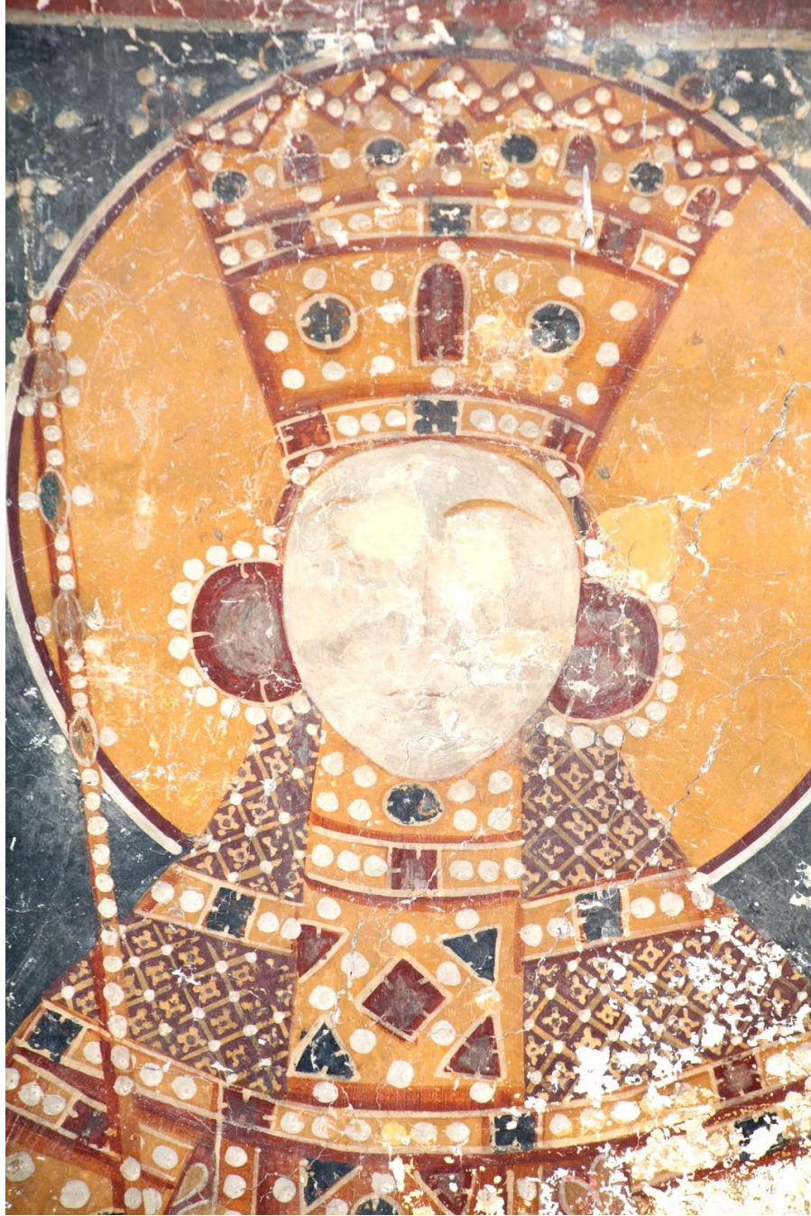
Fig. 6. Queen Simonis, part of the ktetorial composition, St. Joachim and Anne church, Monastery Studenica