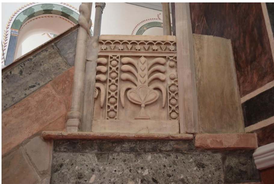
Fig.1 Knotted column, Pantokrator monastery (Zeyrek Camii), Istanbul